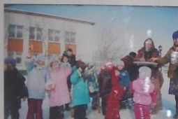
Проводы РУССКОЙ ЗИМЫ