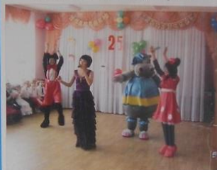
...И ПРОСТО ПРАЗДНИКИ